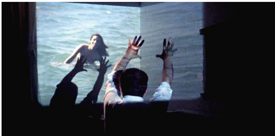
Dillinger est mort de Marco Ferreri (1969).